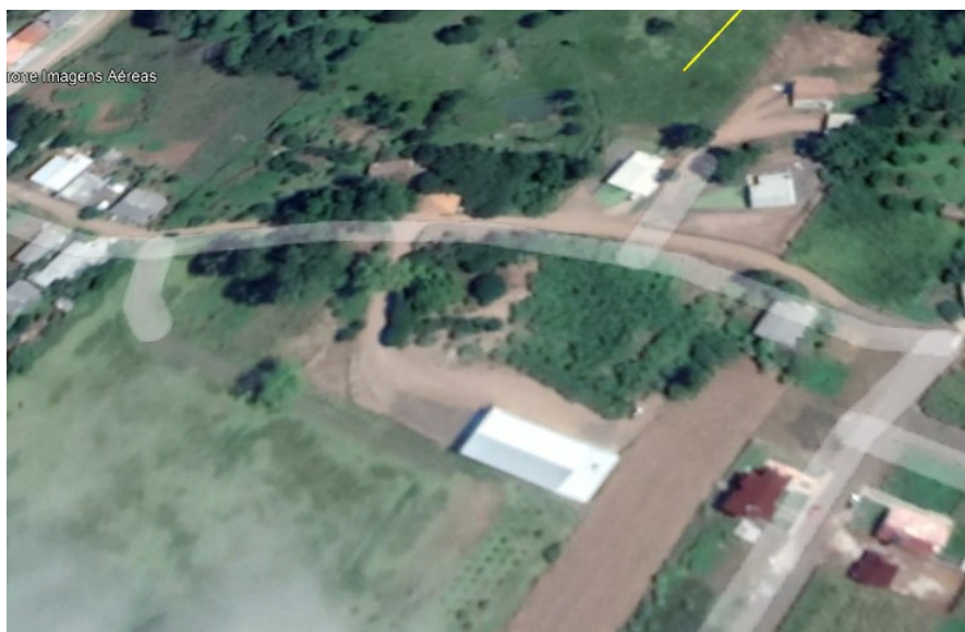
Figura 1 - Localização da instalação.

O projeto contempla o dimensionamento de um sistema de iluminação pública para uma via do município de Anchieta –SC, sendo a Rua Laguna, no prolongamento até o loteamento social. Seguem dados coletados para a formatação do projeto.